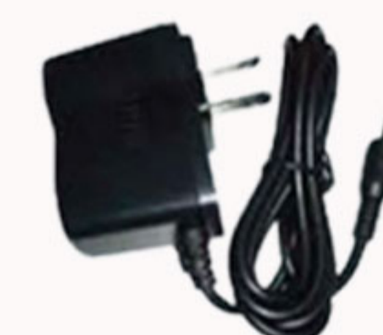
Fonte de energia