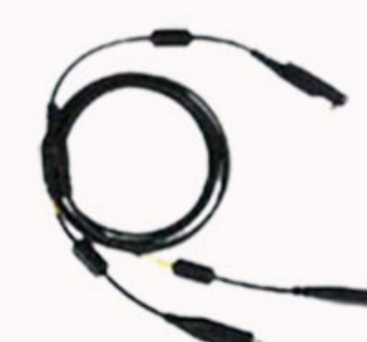
Cabo de programação