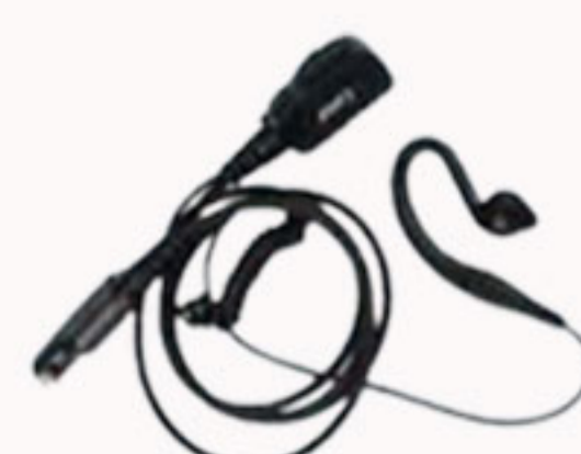
Fone de ouvido