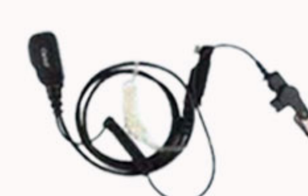
Fone de ouvido translúcido